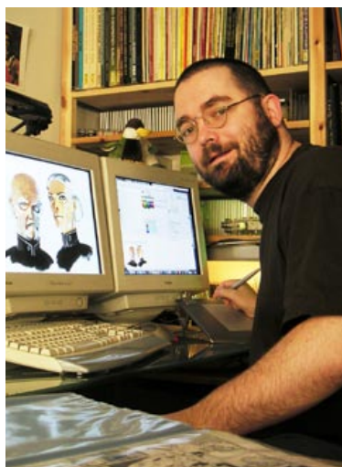
Devant son Apple Macintosh G5.