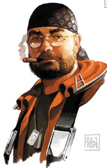
Autoportrait en personnage d'Universal War One. Réalisé sur Adobe Photoshop.