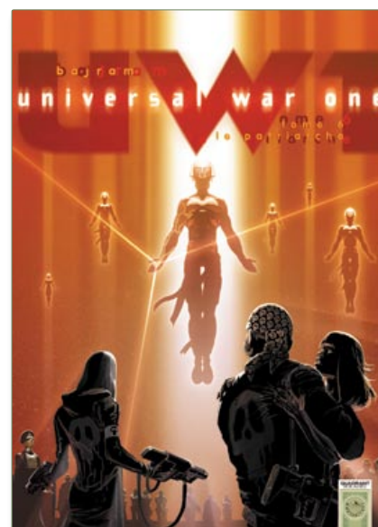
UW1 tome 6 - à paraître le 21 juin 2006