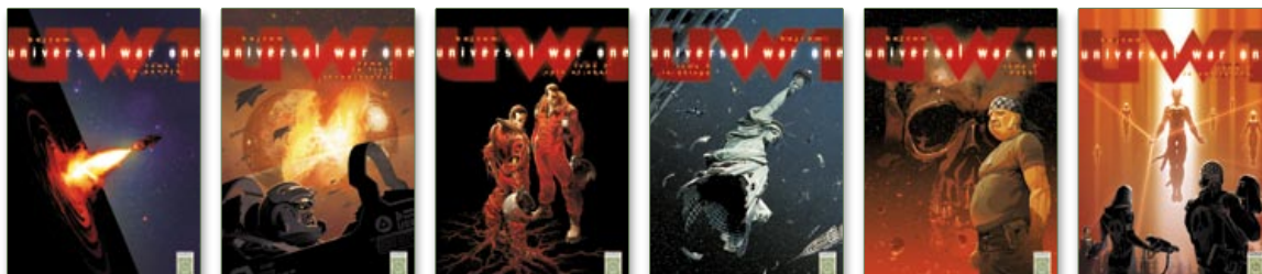
Universal War One, cinq tomes parus, tome 6 à paraître le 21 juin 2006.

UW1 ET BAJRAM SUR INTERNET http://www.bajram.com/